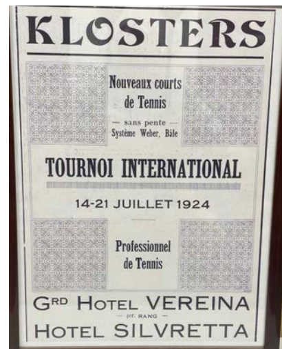
Wertvolle Zeugen der Tennis-Entwicklung in Klosters.