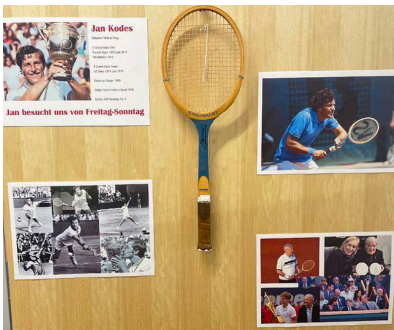
Erinnerungen an Jan Kodes, Wimbledon-Sieger 1973 im smarten Museum verewigt. Am Sonntag weilte Kodes als Ehrengast in Klosters.