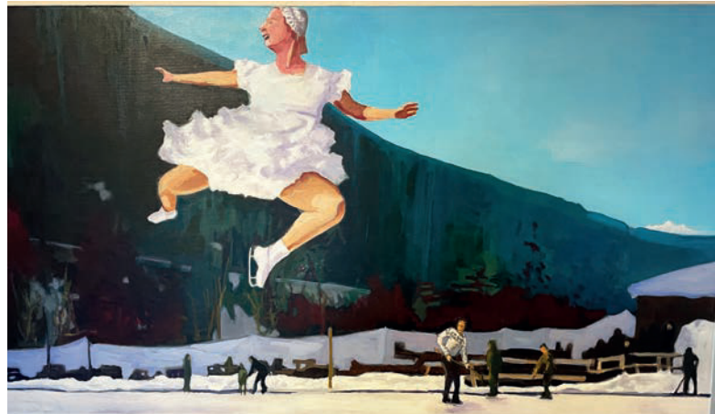
Freude herrscht: Das Prättigau verfügt in Klosters über ein Kunst- & Kulturhaus